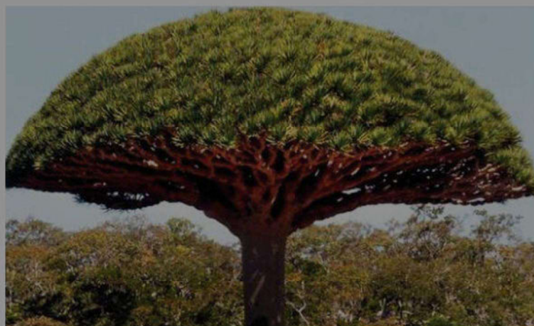
Albero Croton Lechler